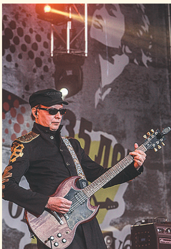
Эдмунд Шклярский Лидер рок-группы «Пикник»

Эдмунд Шклярский – известный и успешный музыкант, создатель группы «Пикник». В середине 1960-х услышал Beatles, Rolling Stones, Animals и под впечатлением от услышанного стал осваивать гитару.